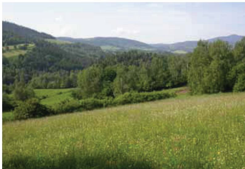
Obr. 4 – Přírodní památka V polích.

Fig. 3 – Míchov Nature Reserve.