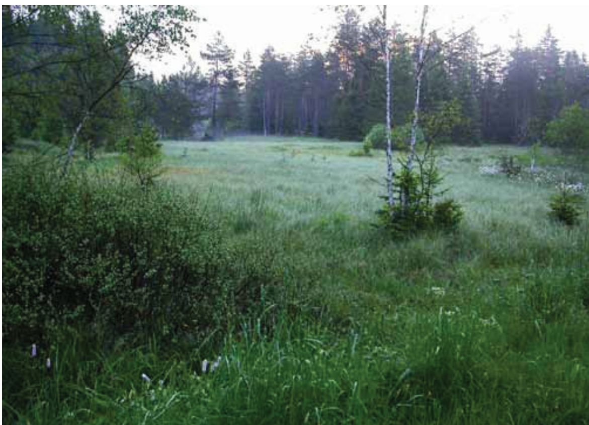
Obr. 7 – Přírodní památka Multerberské rašeliniště.

Fig. 6 – Pod Borkovou Nature Reserve.