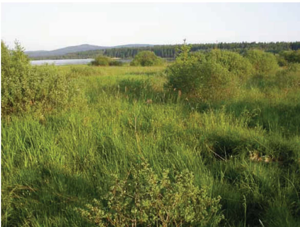
Obr. 6 – Přírodní rezervace Pod Borkovou.

Fig. 6 – Pod Borkovou Nature Reserve.