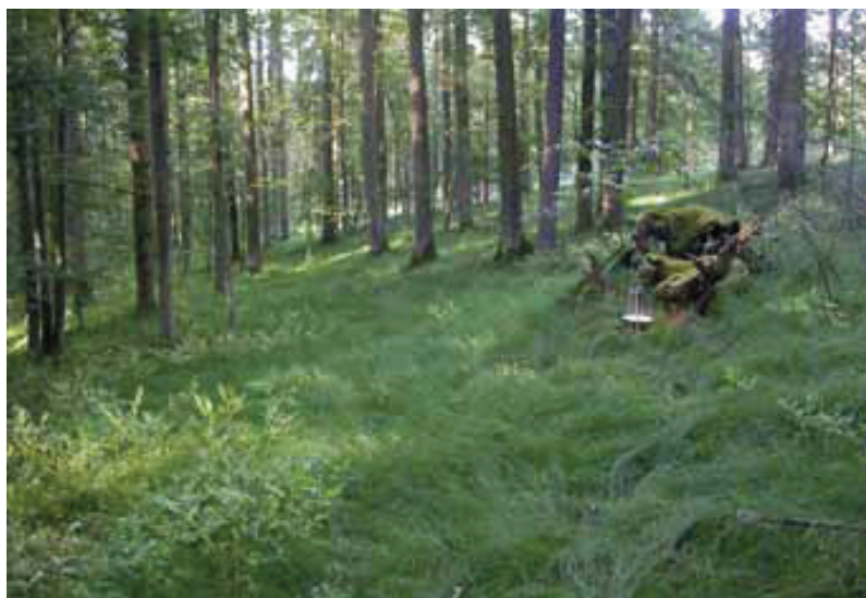
Obr. 3 – Přírodní rezervace Míchov (foto J. Šumpich 2009).

Fig. 3 – Míchov Nature Reserve (photo by J. Šumpich 2009).